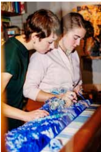
Studio Supersju har gjort infärgning av garn på KKV.