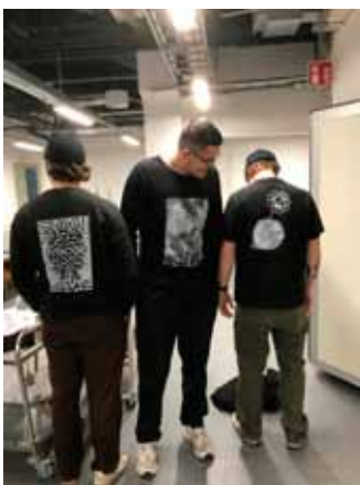
Kurs i textiltryck hölls för studenter från Beckmans.