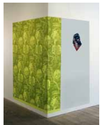
Textiltryck från utställningen BU Höst 2021 på Kristianstad Konsthall.