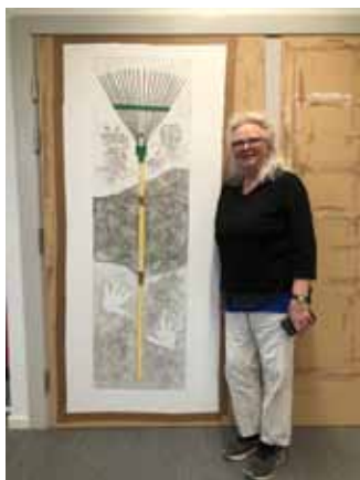
"Räfsa", handkolorerad torrål av Renée Lord som visades på hennes utställning på Grafiska Sällskapet 2021.