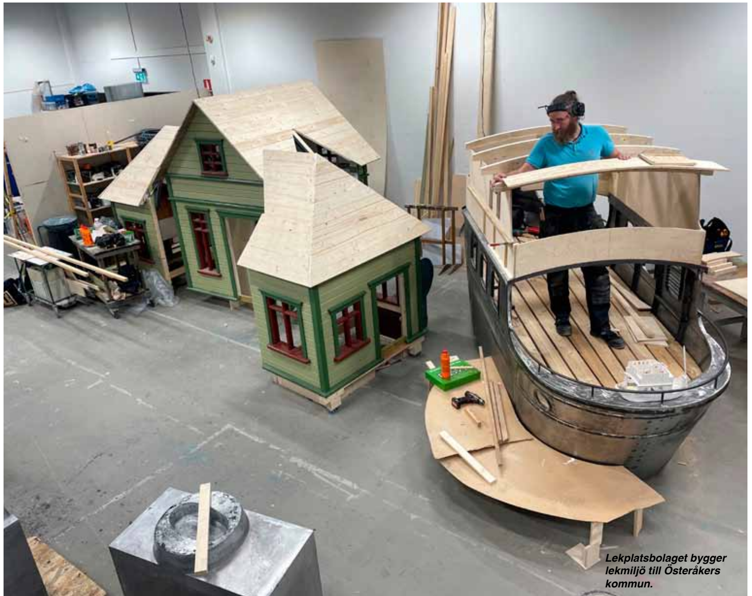
Lekplatsbolaget bygger lekmiljö till Österåkers kommun.