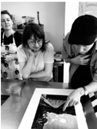
Deltagare på en av två introduktionskurser i fotopolymer som genomfördes i juli och i oktober 2021.